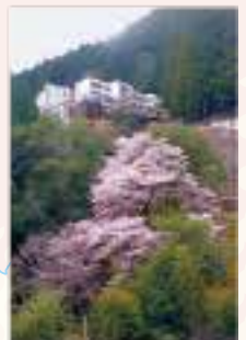
富山地区 見頃 3月中旬~下旬