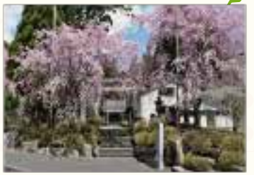
B 道の駅 豊根グリーンポート宮嶋 見頃 4月上旬~中旬