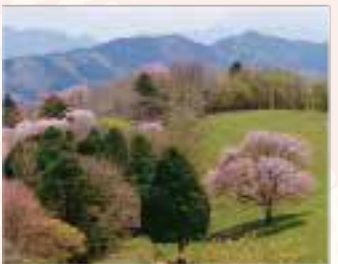
A 茶臼山高原 一本桜 見頃 5月GW前後1週間頃