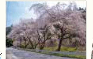
三沢地区 見頃 4月上旬~中旬