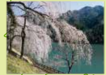
D みどり湖 見頃 3月下旬~4月上旬