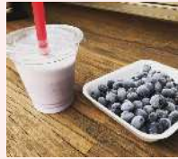
ブルーベリーミルク (茶臼山高原つみきハウス)

茶臼山麓に位置する豊根村では、冷涼な気候を活かしてブルーベリーの栽培が盛んです。村内で標高差があるため、標高の低い場所から順に摘み頃を迎え、7月上旬から8月中旬まで摘み取りが楽しめます。一粒一粒ていねいに栽培されたブルーベリーをぜひご賞味ください。