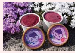
ブルーベリーシャーベット (あさがね農園・道の駅にて販売)