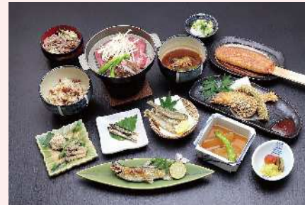
鮎づくしおまかせコース(御宿清水館) ※6～11月 要予約 2名様以上 4950円