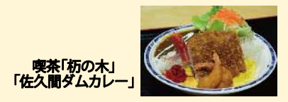
喫茶「朽の木」 「佐久間ダムカレー」