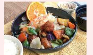
チョウザメ団子の香酢定食 1,400円