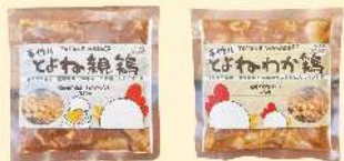
とよね親鶏 とよねわか鶏