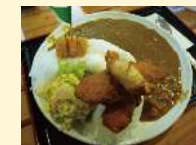
レストランみどり 「みどりダムカレー」